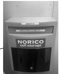
入口右手の壁面に 連絡 BOX 設置