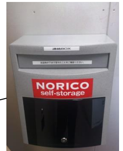
入口右手の壁面に 連絡 BOX 設置